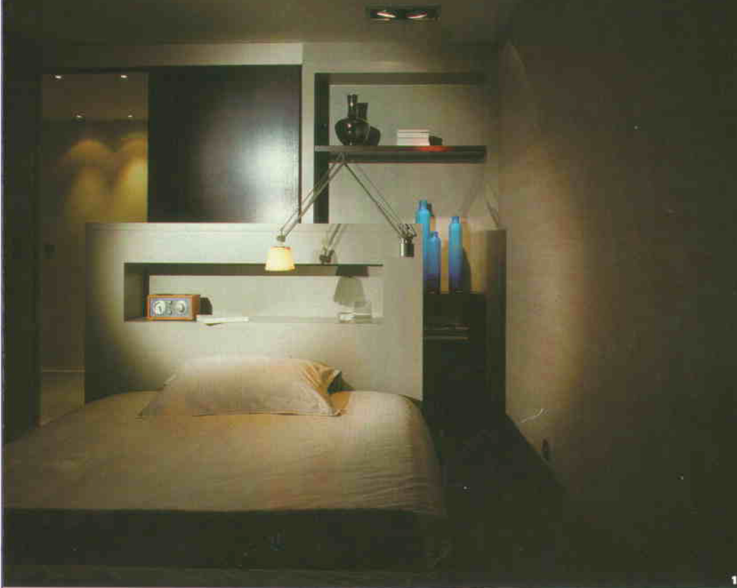
Comme on le découvre sur le plan (4), David Burles (3) a installé côte à côte deux chambres (1) rigoureusement jumelles dans une suite parentale intégrant salle d'eau (2) et dressing épuré.